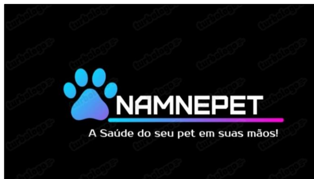
Figura 2 – Anamnepet

O aplicativo desenvolvido foi nomeado como Anamnepet e desenvolveu-se também uma logomarca e sua descrição como sendo “Anamnepet: A saúde do seu pet em suas mãos”, conforme mostra a figura 2.